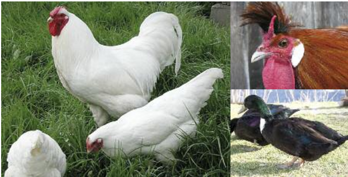
Gesunde Tiere sind die Basis für gute Bruteier

Die richtige Auswahl der Bruteier und deren Behandlung legen die Basis für eine erfolgreiche Zucht. Was dabei zu berücksichtigen ist, erfahren Sie auf diesem Merkblatt.