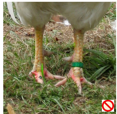
Läufe: gelb oder blau (+ Ring unter Sporn) Pattes: jaunes ou bleues (+ bague sous l'ergot)