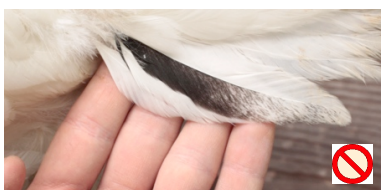
„Russ“ im Gefieder (schwarz pigmentierte Federn) Plumes pigmentées de noir