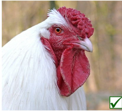
Kehllappen: oval, mittelgross Barbillons: ovales, moyens