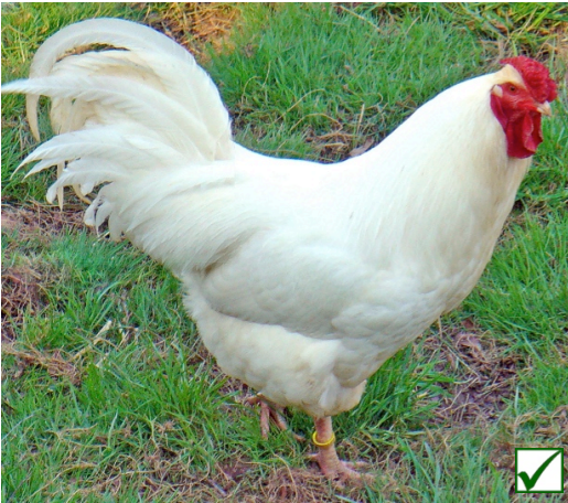
reinweiss • blanc pur