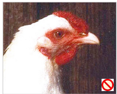
Kehllappen: zu klein Barbillons: trop petits