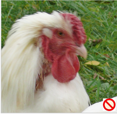
Kehllappen: zu klein Barbillons: trop petits