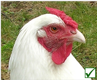
Kehllappen: gut (+ Kammdorn ideal auslaufend) Barbillons: bien formés (+ extrémité de la crête idéale)