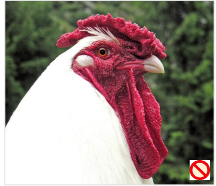
Kehllappen zu lang Barbillons trop longs