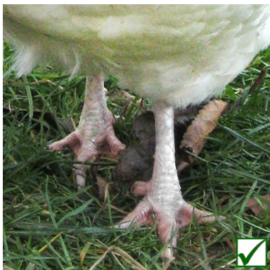
Läufe: weiss, rötlicher Seitenstreifen erlaubt Pattes: blanches, ligne latérale rouge autorisée